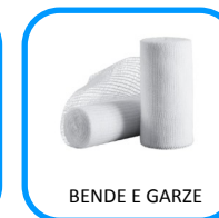
BENDE E GARZE