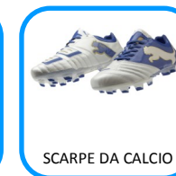
SCARPE DA CALCIO