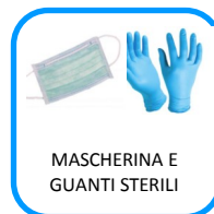
MASCHERINA E GUANTI STERILI