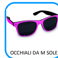
OCCHIALI DA M SOLE